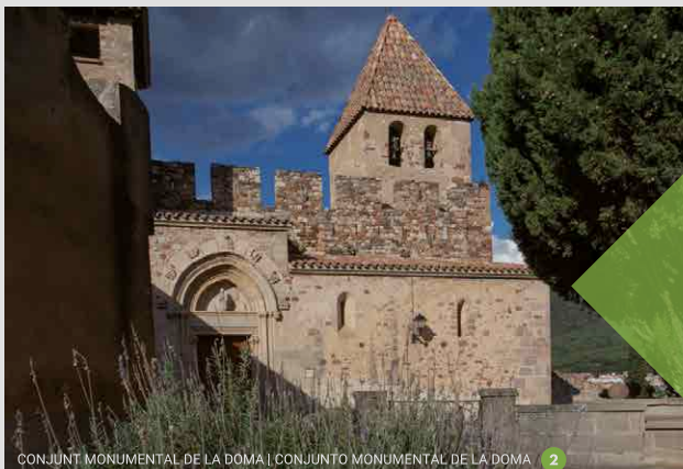
CONJUNT MONUMENTAL DE LA DOMA | CONJUNTO MONUMENTAL DE LA DOMA 2

Observa la naturaleza y disfruta del entorno, pero no dejes huella.