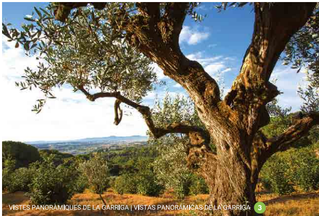
VISTES PANORÀMIQUES DE LA GARRIGA | VISTAS PANORÁMICAS DE LA GARRIGA 3