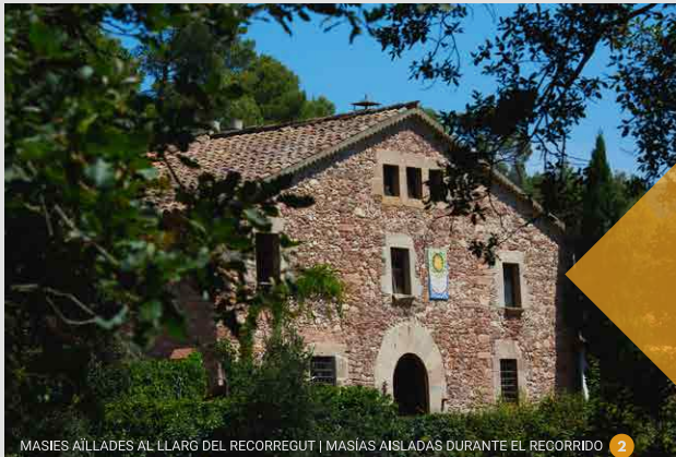
MASIES AÏLLADES AL LLARG DEL RECORREGUT | MASÍAS AISLADAS DURANTE EL RECORRIDO 2

Observa la natura i gaudeix de l'entorn, però no hi deixis petjada.