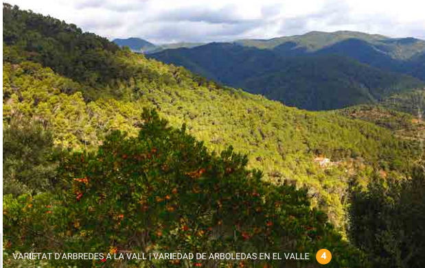
VARIETAT D'ARBREDES A LA VALL | VARIEDAD DE ARBOLEDAS EN EL VALLE 4