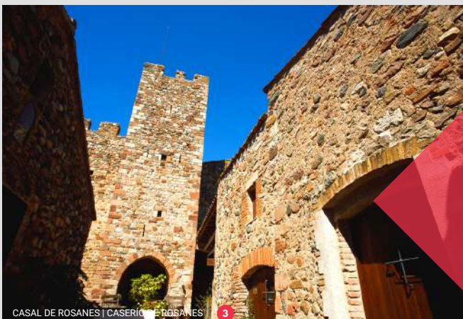
CASAL DE ROSANES | CASERIO DE ROSANES 3

Observa la naturaleza y disfruta del entorno, pero no dejes huella.