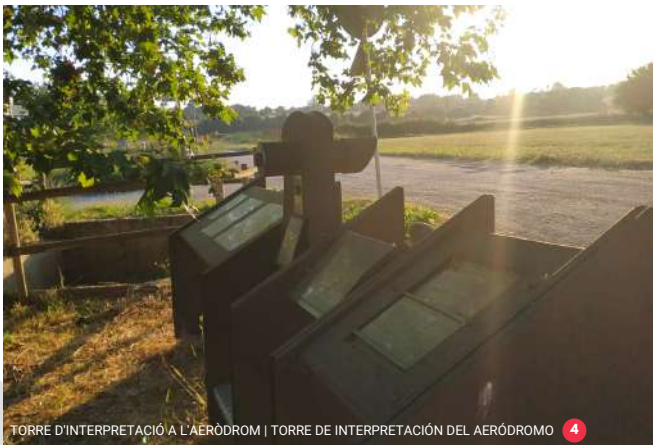
TORRE D'INTERPRETACIÓ A L'AERÒDROM | TORRE DE INTERPRETACIÓN DEL AERÓDROMO 4