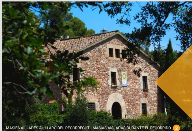
MASIES AÏLLADES AL LLARG DEL RECORREGUT | MASIAS AISLADAS DURANTE EL RECORRIDO 2

Observa la naturaleza y disfruta del entorno, pero no dejes huella.