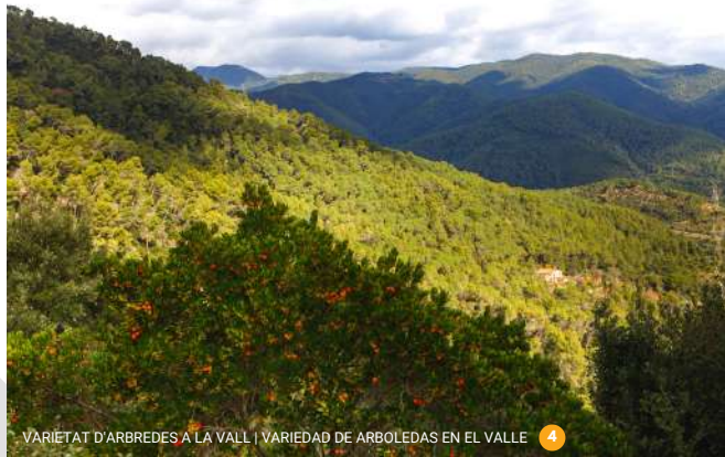
VARIETAT D'ARBREDES A LA VALL | VARIEDAD DE ARBOLEDAS EN EL VALLE 4