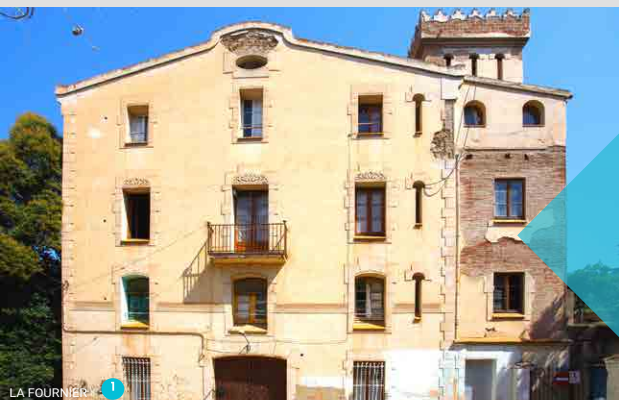
LA FOURNIER 1

Observa la naturaleza y disfruta del entorno, pero no dejes huella.