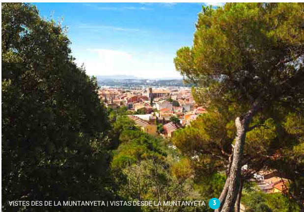
VISTES DES DE LA MUNTANYETA | VISTAS DESDE LA MUNTANYETA 3