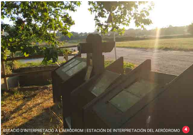
ESTACIÓ D'INTERPRETACIÓ A L'AERÒDROM | ESTACIÓN DE INTERPRETACIÓN DEL AERÓDROMO 4