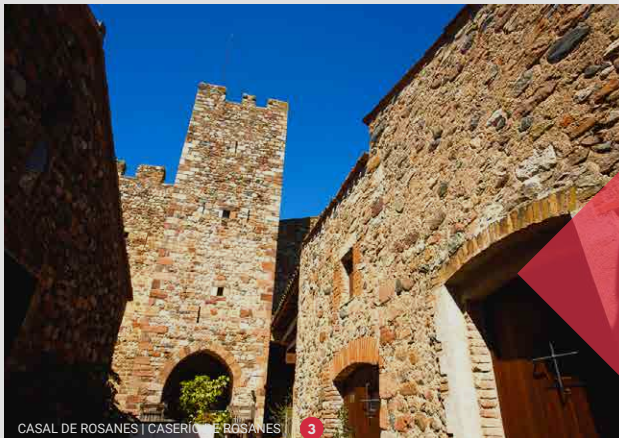
CASAL DE ROSANES | CASERIU DE ROSANES 3

Observa la naturaleza y disfruta del entorno, pero no dejes huella.